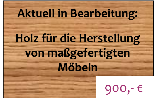
Holzbänke für das Foyer