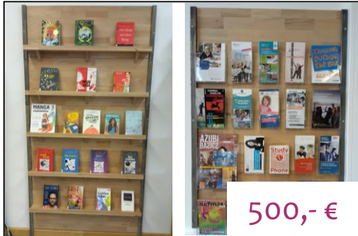
Unterstützung des Bücherei-Umbaus