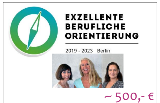
Hausmesse für die BSO