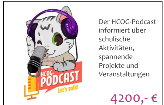
Unterstützung von Fachbereichen/ AGs