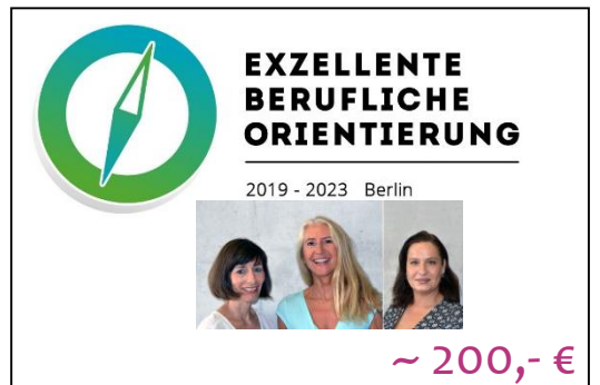
Hausmesse für die BSO