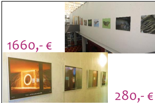
Allgemeine Ausstattung der Schule