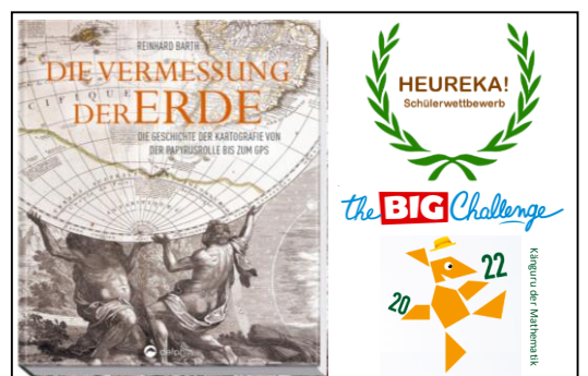
Preise für besondere Leistungen