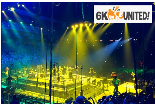
Gebühren für Musikprojekte